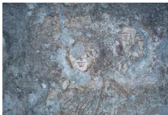
Eremo di San Martino: affresco