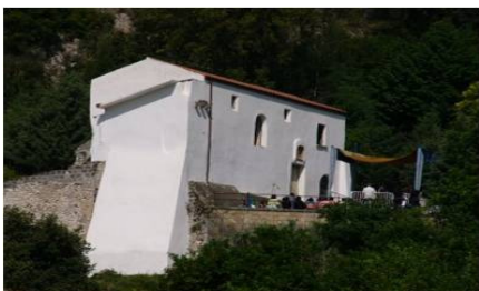
Santuario Maria SS. Grande ed Eccelsa

Dopo aver lasciato alcune auto al Convento di San Francesco e fatta colazione nei bar del centro, si raggiunge con le altre auto il Santuario di Maria SS. Grande ed Eccelsa. Da qui (205 m) parte l'escursione. Su comoda carrareccia, solo in alcuni tratti un po' sdruciolevole, si prende repentinamente quota. Raggiunta quota 400 m, il fondo si trasforma in sentiero e la pendenza diventa più agevole; a tratti, consente un eccezionale panorama su tutti i monti che chiudono ad est la pianura campana.