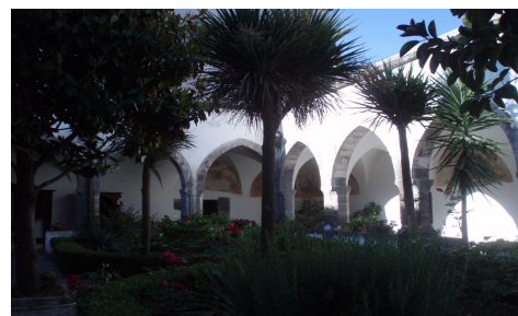
Chiostro del Convento di S. Francesco

Dopo un po', comincia una larga carrareccia; quasi subito, a destra, si stacca il sentierino che, svalicando a 418 m, una lunga cresta tra Monte Pecoraro (552 m) e Monte Tre Croci (541 m) conduce al comune di Avezzano di Sessa Aurunca, da cui annualmente la terza domenica di maggio parte un pellegrinaggio di devozione per il Santuario. Dopo circa altri 20 minuti, si lascia a sinistra un bivio, che scende a Casanova di Carinola passando per la zona dei Greci, e si prosegue ancora sulla comoda carrareccia.